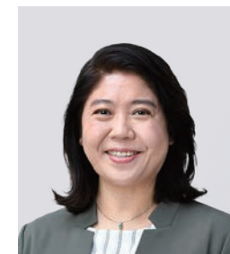
(株)電通グループ フェロー コレクティブ・インパクト 推進担当 電通総研副所長 大日方 邦子